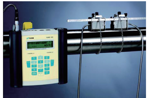
管道固定夹具快速安装